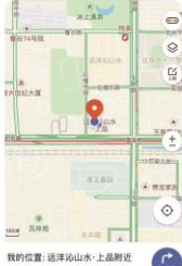
我的位置：选泽八宝山上品附近 石泉山区图书馆八宝山一品分馆(图中红色箭头)