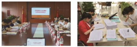
01 | 石图资讯 2018/第三季度