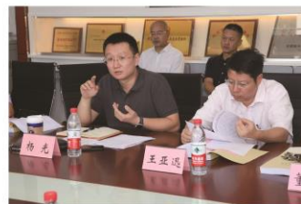
第三季/2018 石图资讯 | 04