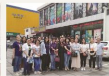
石景山区图书馆党员、积极分子集体观看电影《青年马克思》