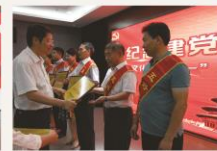
“七一”主题党日活动中，石景山区图书馆获得五好党支部和团结互助党员团队的荣誉称号