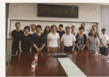
石景山区图书馆和北京工业职业技术学院进行党支部联学联研学习交流