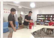
石景山区图书馆进行消防安全教育培训，指导员工正确使用灭火工具