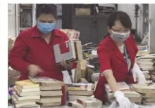
23 | 石图资讯 2018/第二季