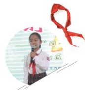
第二季/2018 右图资讯 | 04