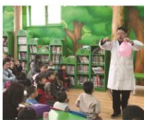
01 | 右图资讯 2018/第二季