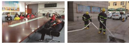
第四季/2018 石图资讯 | 04