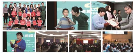
(宣传转导活动部供稿)