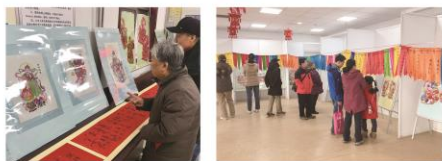
01 | 石图资讯 2019/第一季