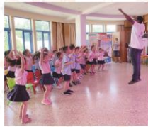
13 | 石图资讯 2019/第三季度

富有童趣黏土作品的泥塑工坊、色彩丰富的外文阅览室、炫酷迷彩风的军事阅览室、科幻奇妙的数字阅读体验空间……色彩亮丽的阅览室和花样迭出的阅读体验设备让孩子们目不暇接，直呼“过瘾”。