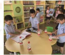
第三季/2019 石图资讯 | 14