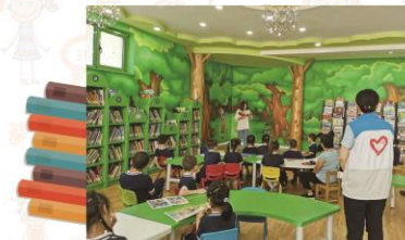
15 | 石图资讯 2019/第三季度

9月25日、26日，新学期开学后第一批学生走进石景山区图书馆。这些来自石景山区实验中学和海特小学的240名学生穿着整齐的校服，排队穿过绿色通道，顺着盘旋而上的楼梯，兴趣盎然地探秘于色彩斑斓的石景山区图书馆少儿馆，仔细聆听这座“会讲故事”的图书馆告诉他们的关于“阅读”的故事。