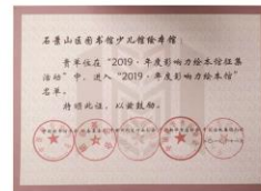
(宣传辅导活动部供稿)

荣誉属于过去，历史将掀开新的篇章。石景山区图书馆少儿馆绘本馆将继续往开，坚持秉承公益性服务机构的基本原则，将中国传统文化与国际新理念相融合，更好地满足广大亲子家庭的文化阅读需求。为石景山区创建全国文明城市和国家公共文化服务体系示范区做出应有的贡献。