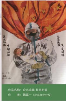
作品名称：众志成城 共克时艰 作者：魏高一（北京九中分校）

作为线上活动打头阵的第一个尝试，小小书虫俱乐部——英文亲子阅读活动精心挑选了一本讲述新冠病毒的绘本，以深入浅出的方式向少儿读者科普普及了这种病毒的产生、危害和防范方法。接下来，小小书虫俱乐部还将针对少儿读者在疫情居家不出背景下的心理特征和阅读需要，持续开展适合他们的绘本阅读活动。