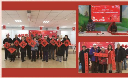
(宣传辅导活动部供稿)

本次活动的春联均是由石景山区多位书法家现场为读者们创作。“丙午有庆猪辞岁 子夜无声鼠报春”、“才见肥猪拱户 又迎金鼠临门”等一副副饱含吉祥寓意的春联伴着石景山区图书馆对广大读者的美好祝福送到了他们手中。值得一提的是，该活动在石景山区图书馆和少儿馆同步举办，少儿馆的春联创作是由小读者们亲手完成。真正意义上实现了老少同乐、全民共庆。