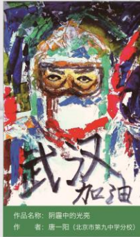
作品名称：阴霾中的光亮 作者：唐一阳（北京市第九中学校）

在武汉等地爆发新型冠状病毒肺炎之际，为了配合疫情防控需要，全力做好防控工作，石景山区图书馆（总馆及少儿馆）暂停对外开放，但是，停馆不停服务。为了最大程度满足习惯来到图书馆和图书分馆参加阅读活动的读者和亲子家庭的文化需求，石景山区图书馆在闭馆的背景下求新思变，打破固有模式，将线下活动转至线上，利用新媒体手段探索出开展活动的新模式，为读者继续提供最贴心、最便捷的服务。