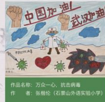
作品名称：万众一心，抗击疫情 作者：张惟伦（石景山外语实验小学）

此外，石景山区图书馆充分发挥总分馆制的阵地优势，通过积极与多个分馆活动负责人的沟通协商，实现了一场活动多个社区参与的联动效应，有效扩大线上活动地服务辐射范围，大幅提升线上服务效能。备受广大居民读者喜爱的快乐阅读直通车虽然暂时不能“开”进社区，却依然以视频的形式与爱好手工的读者见面，通过创作剪纸作品“剪疫”“众志成城”等表达老百姓对“疫”一线的医护工作者的歌颂和祖国必胜的信心。