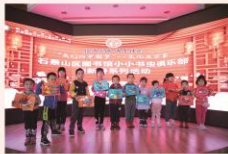
(宣传辅导活动部供稿)

作为“我的中国梦”——文化进万家系列活动之一，小小书虫俱乐部通过低龄读者喜爱的讲故事辅以手工制作的方式，向孩子们普及中华民族最隆重的传统节日——春节的起源和民间习俗。“紫色的饺子是妈妈喜欢的手头馅，绿色是爸爸喜欢的白菜馅”听着孩子一本正经的介绍，坐在身边的父母脸上笑开了花。